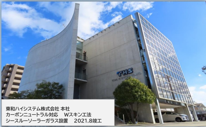
東和ハイシステム株式会社 本社 カーボンニュートラル対応 Wスキン工法 シースルーソーラーガラス設置 2021.8竣工