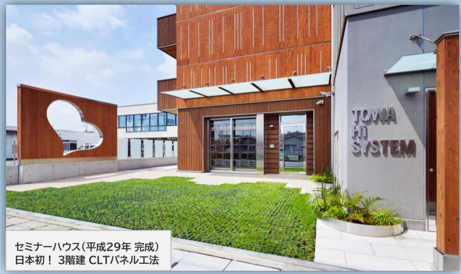
セミナーハウス(平成29年完成) 日本初! 3階建 CLTパネル工法